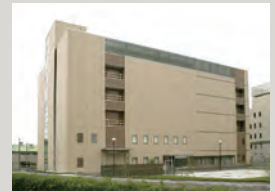
株式会社TOKAIコミュニケーションズ データセンター

株式会社TOKAIコミュニケーションズ 〒420-0034 静岡県静岡市葵区常盤町2丁目6番地の8 http://www.victokai.co.jp/index.html