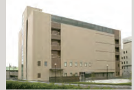
株式会社TOKAIコミュニケーションズ データセンター

株式会社TOKAIコミュニケーションズ 〒420-0034 静岡県静岡市葵区常盤町2丁目6番地の8 http://www.victokai.co.jp/index.html