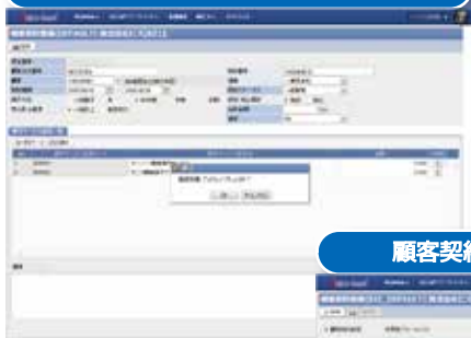
顧客契約検索画面 (イメージ)