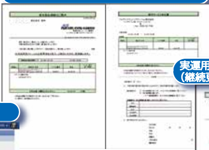
実運用されているレイアウト (継続更新)