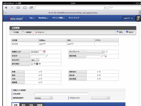
▲出張精算申請画面(タブレット)