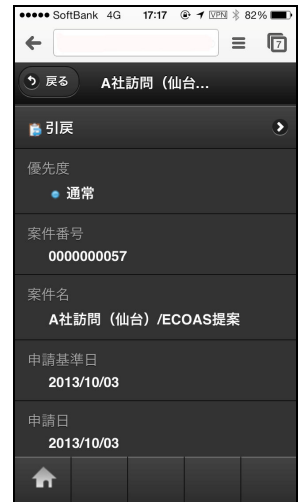
▲出張精算明細画面(スマートフォン)

※掲載されている会社名及び商品名は各社の商標または登録商標です。※画面はイメージです。実際のものとは異なる場合がございます。 ※価格はおお客様の利用環境により変動いたします。※いずれの金額にも保守料金は含まれておりません。※オプション機能には別途費用がかかります。 ※1:「駅すばあと」と連携するためには「駅すばあとイントラネット」を別途購入する必要があります。