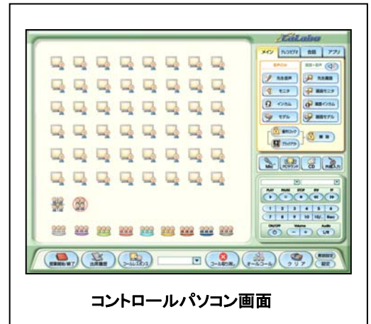
コントロールパネル画面