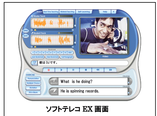
ソフトテレコ EX 画面