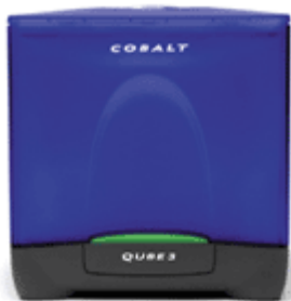
Sun Cobalt Qube™ 3 Plus