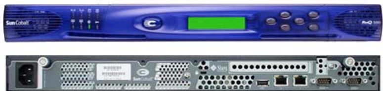
Sun Cobalt RaQ™ 550