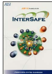
▲ALSI InterSafe パッケージ

今回、ALSIより発売を開始した「InterSafe for ISA Server」は、マイクロソフト株式会社の「ISA Server」にプラグインし、フィルタリング・ファイアウォール・キャッシュの3つの機能を、統合的に実現させることが可能です。このため、ネットワーク管理者に構築の負担をかけない安全なセキュリティシステムを実現することが可能となります。