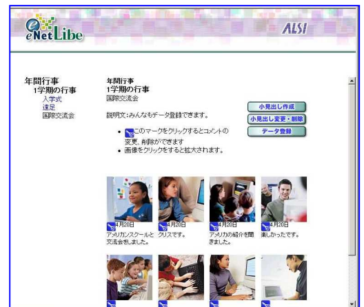
デジタルバインダーの閲覧画面