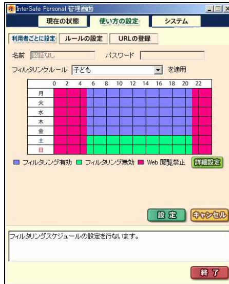
時間帯、曜日など細かい設定が可能