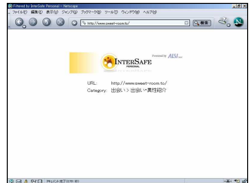
有害サイトを閲覧した際の規制画面