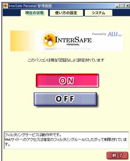
容易なフィルタリング切り替えが可能