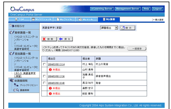
課題・レポート提出管理画面