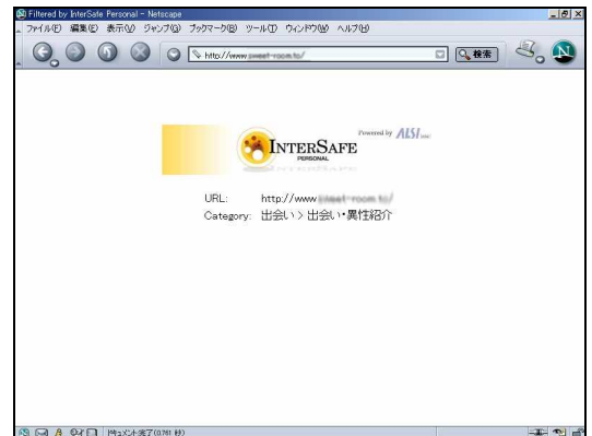
有害サイト規制画面

クライアントモジュールのバージョンアップは全自動で行われ、手動で新しいモジュールをダウンロードすることは不 要です。