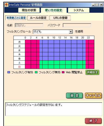
フィルタリングスケジュール設定画面

InterSafe はアルプス システム インテグレーション株式会社の登録商標です。 フィルタリングエンジンおよび URL データベース供給元: ネットスター株式会社