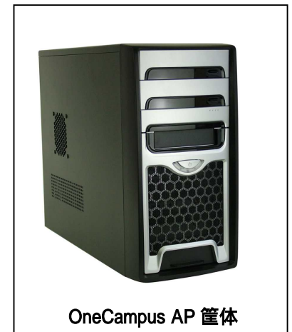
OneCampus AP 筐体

そこで ALSI は、このようなニーズに対応するため、「e-Learning システム」「講義情報ポータル」を一括で管理することができるオールインワンサーバ「OneCampus AP」を2006年2月15日より発売開始いたします。学内の情報やデータを一括管理することにより、管理負担やコスト軽減を図り、教室での授業から教室外での学習までを、継続して行うことのできる環境をご提供いたします。