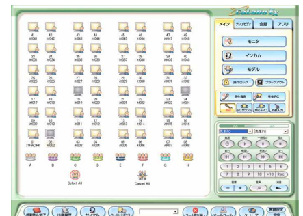
CaLabo EX 操作画面

上智大学に導入している「CaLabo EX」は、音声や動画素材をLANのみで転送するフルデジタル学習システムで、動画学習ツール「ムービーテレコ」で映像素材を繰り返し学習することができるなど、効果的な語学学習を行うことが可能です。