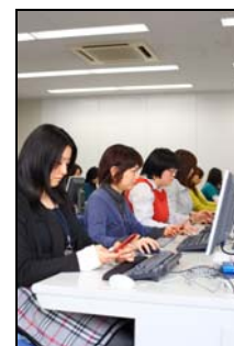
▲ ネットスター社 URL リサーチセンター