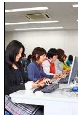
ネットスター社 URLリサーチセンター

ポリシー設定や各種管理は、管理者がASPサーバ内のCATS管理サーバにアクセスして実行します。グループ設定やユーザ管理など、管理機能も充実しており、ポリシーの更新も自由に行うことができることから、サーバ、ハードウェア、運用コストの削減が可能となり、高水準なIT管理を手軽に実現することができます。