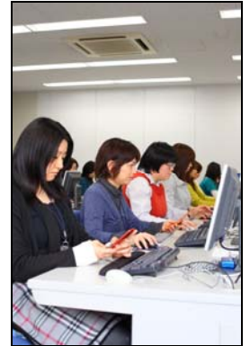
▲ネットスター社 URL リサーチセンター

「InterSafe Personal」が規制する URL データベースは、ALSI のグループ会社であるネットスター株式会社より提供されており、2009 年 2 月現在、約 8,200 万ページに及ぶ URL データベースが登録されています。日本国内最大規模の約 40 名の専任リサーチャーが目視で確認し、毎日更新しております(URL リサーチセンター: 仙台・東京・中国)。精度の高い URL データベースを使用することで、インターネットの有用性を損なうことなく、有害サイトを規制することができます。また、ALSI 及びネットスターは、携帯電話におけるフィルタリングサービスにも力を入れております。InterSafe や URL データベースは、携帯電話会社 5 社 (NTTドコモ、KDDI、ソフトバンクモバイル、ウィルコム、イー・モバイル) に採用されております。