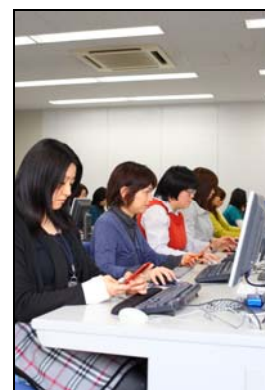
▲ネットスター社 URL リサーチセンター

また ALSI は、携帯電話での有害情報フィルタリングにも力を入れており、ウィルコム of フィルタリング(閲覧制限)サービス用に「InterSafe」を提供しております。また、ネットスターの URL データベースは、NTT ドコモ、au、ソフトバンクモバイル、イー・モバイルのフィルタリングサービスにも採用されています。