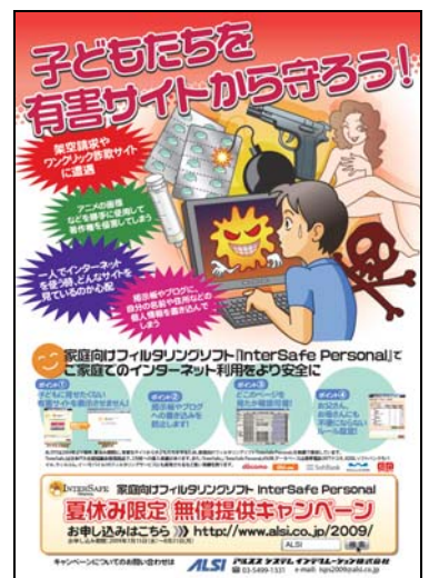
▲キャンペーン告知ポスター