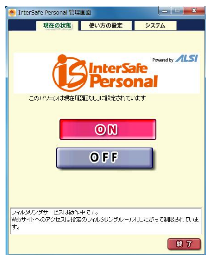
▲ON、OFF の切り替えは、とても簡単です。