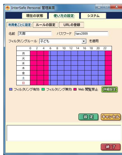
▲曜日や時間帯の変更も容易です。