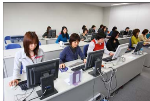
▲ネットスター社のURLリサーチセンター

「InterSafe WebFilter」のURLデータベースは、ALSIのグループ会社であるネットスター株式会社より提供されており、約40名の専任リサーチャーが目視で確認し、毎日更新しております(URLリサーチセンター:仙台・東京・中国)。「InterSafe WebFilter」およびURLデータベースは、携帯電話会社5社(NTTドコモ、KDDI、ソフトバンクモバイル、ウィルコム、イー・モバイル)にも採用されております。2010年8月現在、2億7437万6480ページ(87カテゴリ ※ユーザ設定カテゴリ10を含む)に及ぶURLデータベースが登録され、精度の高いURLデータベースを1日3回以上、365日提供することができることから、被害の絶えない「フィッシング詐欺」や、ウイルス感染につながる悪質なサイトなどへのアクセスを未然に防ぎ、より強固なセキュリティ対策を講じることが可能となっております。