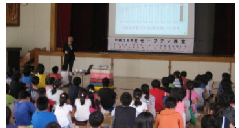
全国読売防犯協会による、杉並区立桃井第五小学校での児童向け講演会の様子。ALSI より講師が参加し、保護者向けにも説明を行った。

昨今、スマートフォンやタブレット端末などが急激に普及し、利用者の低年齢化が進んでいます。そのため、インターネット利用環境に潜むリスクを回避するための最新知識、フィルタリングの必要性、家庭でのルール作りと相談しやすい環境作りについて、小中高校の児童生徒、保護者、指導者向けに、再実施を含め年間数十回の講演会を行っています。夏休み期間の無償提供も啓発活動の一環として2004年から開始し、今年で10年目を迎えました。今年新たに、警察庁、総務省および経済産業省と民間事業者等で構成されている官民ボードで提供している「ここからセキュリティ!」夏休み特集ページと連携し、啓発活動をさらに促進いたします。