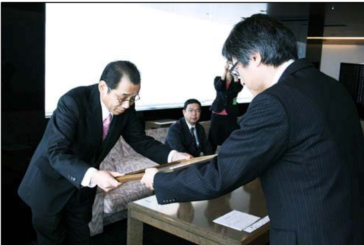
▲2013年2月1日、読売新聞東京本社において、表彰式が挙行されました。

(※)開催記録は http://intersafe.jp/personal/06.html をご参照ください。