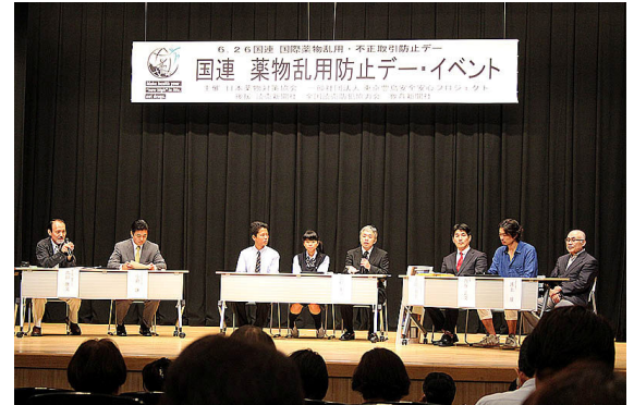
6月28日に東京都豊島区で開催された、日本薬物対策協会主催の「国連 薬物乱用防止デー・イベント」の様子。ALSI はフィルタリングを提供する第一人者としてパネルディスカッションに登壇しました。

夏休み期間フィルタリングソフト無償提供も、啓発活動の一環として行なっておりますが、今年の新たな取り組みとして、一般財団法人インターネット協会が作成した、インターネット利用時に知っておきたい「その時の場面集」への執筆協力や、日本薬物対策協会主催の「国連 薬物乱用防止デー・イベント」への参加など、啓発活動の幅をさらに広げ、インターネットを利用する人々の安全を守る活動を推進しています。