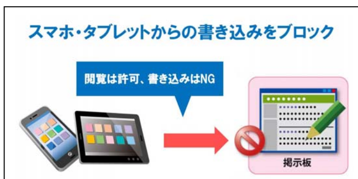
▲「書き込み規制機能」のイメージ

また、iOS/Android 版では「クライアント証明書」に対応いたしました。スマートデバイスから、証明書が必要な社内システムやファイルサーバーにアクセスできるようになります。