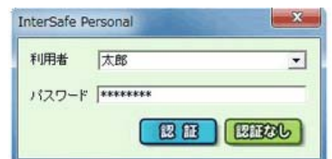
▲マルチアカウント機能により、家庭内で複数の利用者の切り替えが可能。