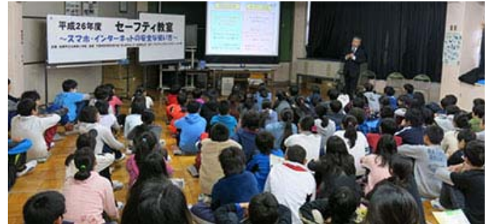
▲小学校での「スマホ・インターネットの安全な使い方」講演の様子

スマートフォンやタブレットなどの利用者の低年齢化が進み、インターネット利用環境に潜む危険を回避するための最新知識、フィルタリングの必要性、家庭でのルール作りと相談しやすい環境作りについて、わかりやすく伝える工夫をしながら、小中高校の児童生徒、保護者、指導者向けに年間100 回以上の講演会を行なっています。