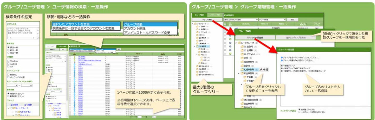
▲ 「InterSafe CATS Ver. 4.6」主な新機能

ワイルドカードを利用した例外 URL 登録に対応しました。頻繁に URL が変更されるコンテンツに対し、URL 中の固定文字列部分のみ登録しておくことで、常時フィルタリングが可能になります。その他、例外 URL の一括登録/出力や SSL デコード無効時の HTTPS サイト規制 (Windows 版はドメイン単位、Android/iOS 版は URL 単位でフィルタリング) に対応しました。