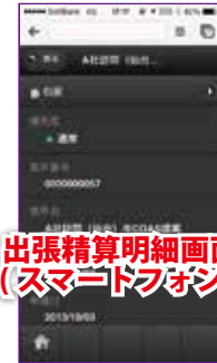
出張精算明細画面 (スマートフォン)