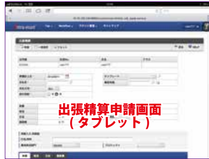
出張精算申請画面 (タブレット)