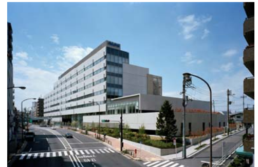
▲本社ビル(東京都大田区)