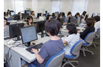
URLリサーチセンター

それぞれの組織にとっての理想的なアクセスポリシーを、管理者がフィルタリング製品を通じて実現するためには、高品質なURLリストが欠かせません。ネットスター社が運営する日本国内最大規模のセンターは、日本のユーザが一番必要とするものをご提供するために、今日も休むことなく調査・収集・分類作業を続けています。